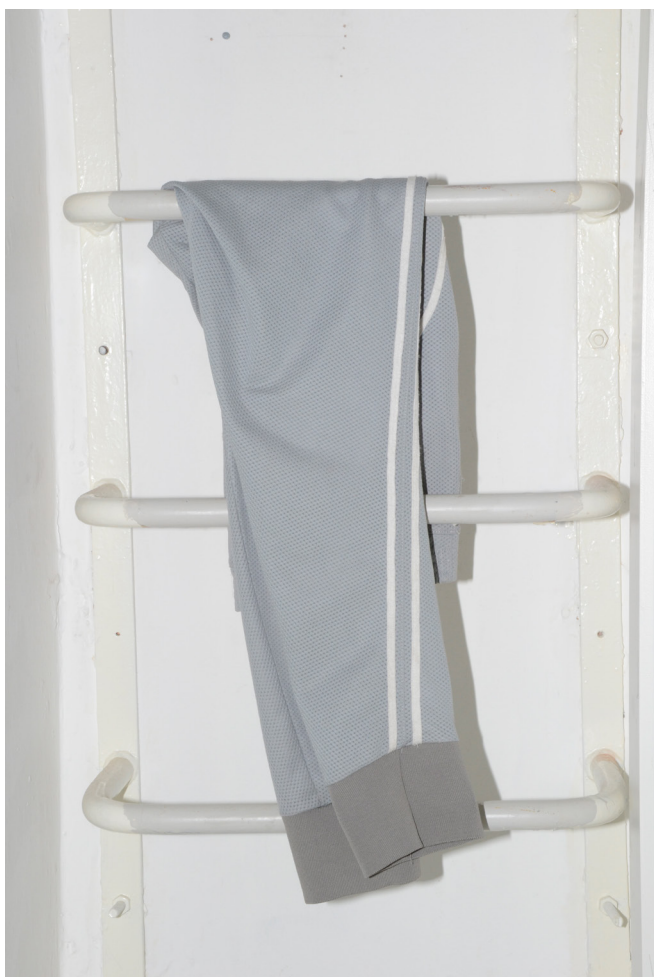
Seba Stolarczyk House of Base Survêtement, collection printemps-été 2017